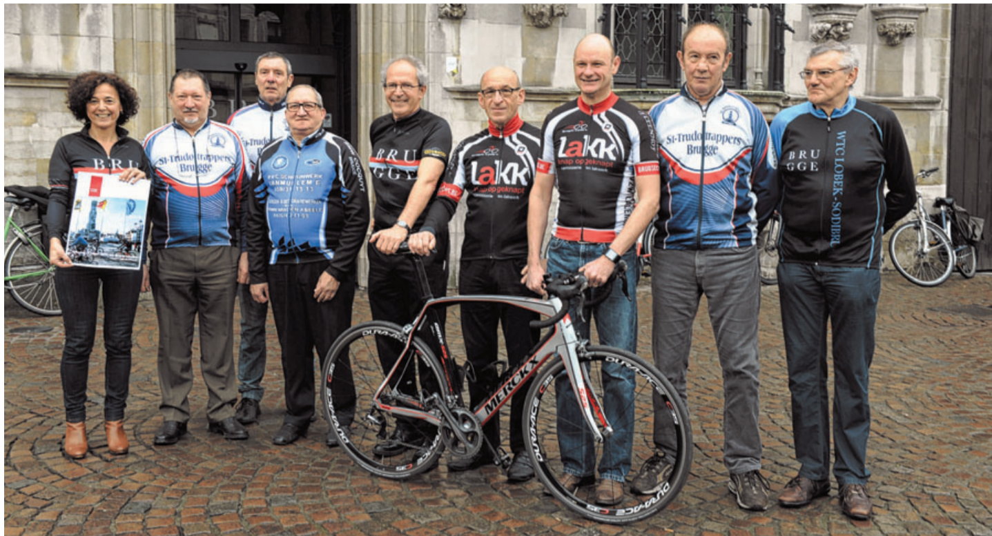
Ook de tweede Brugge Classic wordt mede mogelijk gemaakt dankzij de samenwerking met Brugse wielclubs.

BRUGGE - Samen sterk. Dat is het devies van de acht Brugse wielclubs die ook de tweede editie van Brugge Classic gangmaken. Deze 75 kilometer lange fietstocht biedt eenieder de kans zich wielprof te voelen. Deelnemers krijgen immers de kans om gedurende enkele uren in en rond Brugge op de openbare weg te rijden als waanden ze zich Greg Van Avermaet.